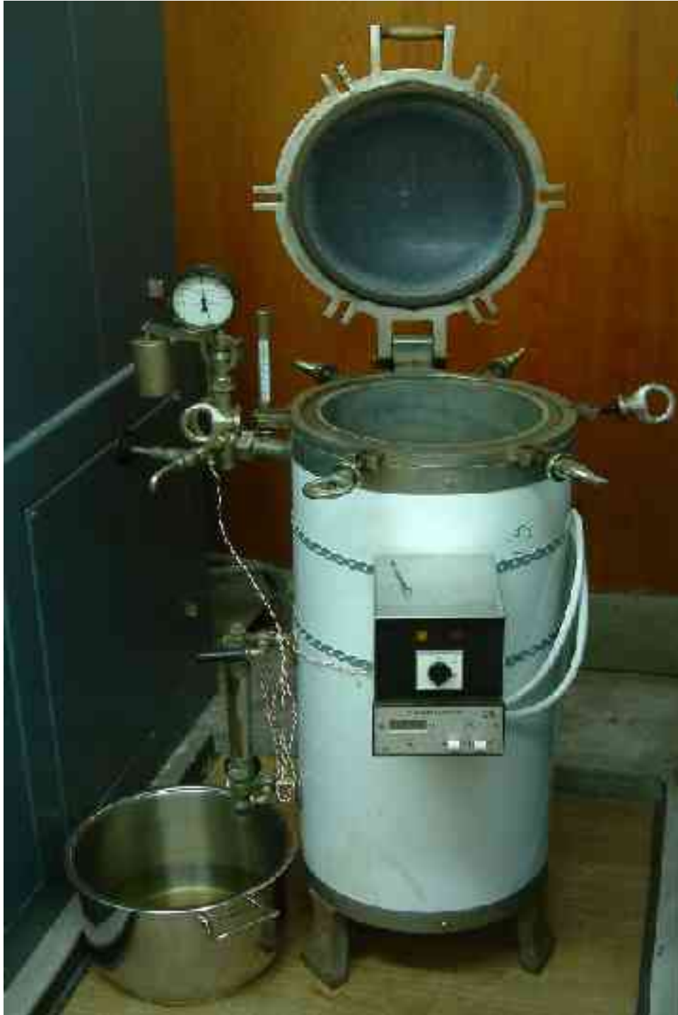
1. kép A hőmérséklet szabályzóval felszerelt autokláv