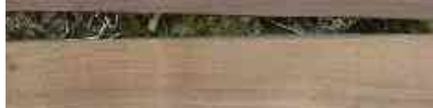
4. kép A száraz állapotban gőzölt akácminták fényképei